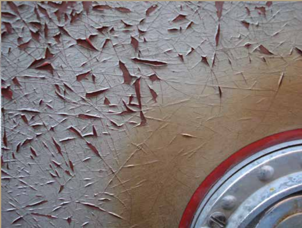
Serie Autos / impresión digital / medidas 20 X 25 cm