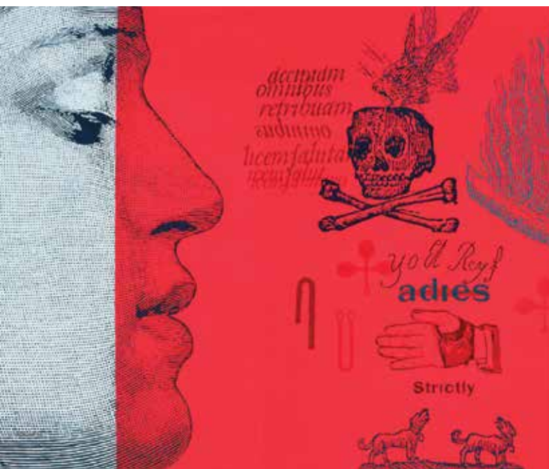
El sonido de tu huella. Detalle. Óleo sobre lienzo. 130 x 195 cm.

La tensión entre estas dos visiones, en Europa y en Latinoamérica, está presente y continuará en el futuro. Pero no puede negarse la presencia y la importancia creciente de la educación a lo largo de la vida en las agendas internacionales. Prestando atención, por ejemplo, a la sexta Conferencia Internacional de Educación de Adultos (CONFITEA VI), que acogió Belém (Brasil) en 2009, Emilia Prestes, se hizo eco de la relevancia de pasar de la retórica a la acción –uno de los lemas más recurrentes en la propia conferencia– y observó que resulta simple “establecer análisis y proyecciones sobre los aprendizajes de las personas jóvenes y adultas sin comprender el contexto sociopolítico y económico donde estas personas están insertas.” (Prestes, 2011: 250) (trad. propia). Un año después de esta VI Conferencia, en el Informe Mundial sobre el Aprendizaje y la Educación de Adultos (UNESCO, 2010) se pone el acento desde el primer capítulo a la educación de adultos en la perspectiva del aprendizaje a lo largo de la vida. “Actualmente tenemos un panorama de la educación de adultos y del aprendizaje a lo largo de toda la vida donde coexisten principios, políticas y prácticas diversos, con la evolución de sistemas abiertos y flexibles de oferta, capaces de adaptarse al cambio social