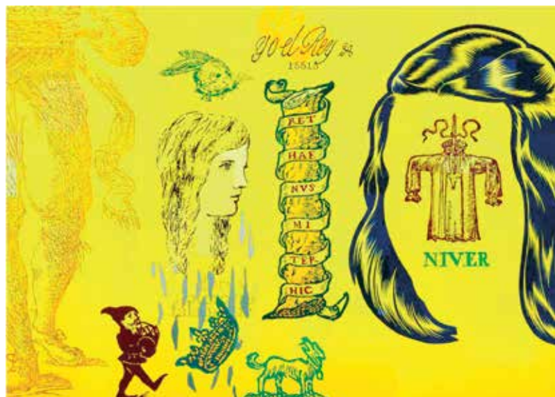
La voz y la sombra. Óleo sobre lienzo. 114 x 162 cm.

La educación superior, y las universidades dentro de ésta, contribuyen al desarrollo de la ciudadanía a través de la formación de las y los estudiantes. El concepto general que se utiliza en referencia a la contribución social de los intelectuales –y aquí entra en juego el papel de las universidades– es el de ciudadanía. (Veugelers y