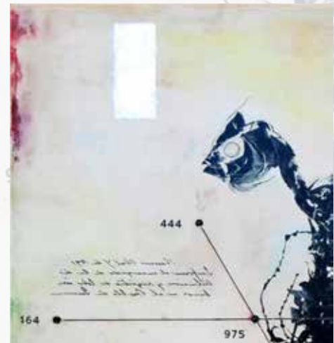
A10028. Detalle. Encausto-Madera. 61 x 64cm.