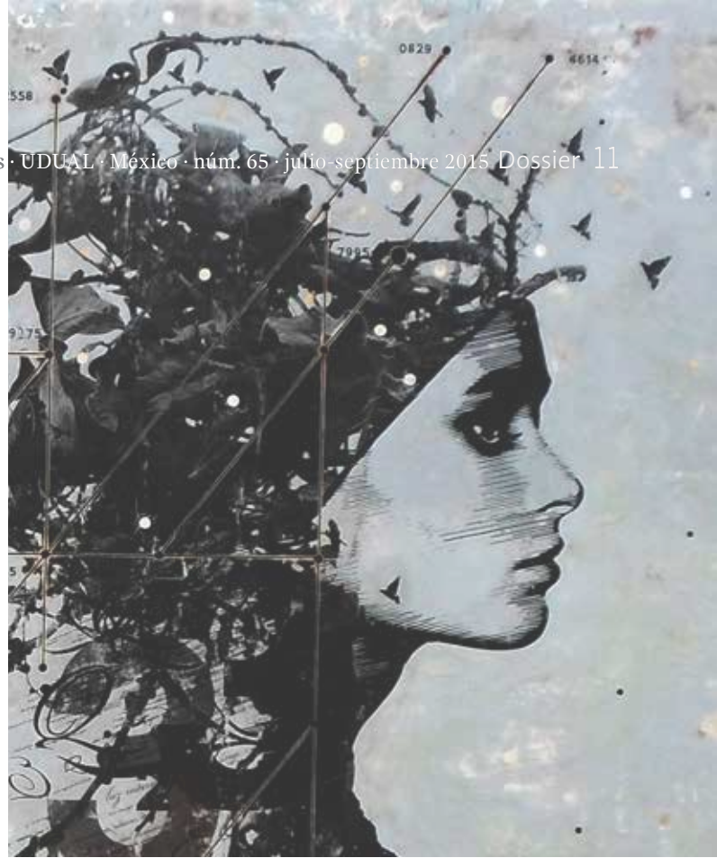
G10033. Detalle. 122 x 244 cm.

París, surgió en el entorno de la escuela catedralicia de Notre Dame, donde se enseñaba, como en otras de Chartres, Laon, Tours o Reims que no llegaron a formar estudios generales o universidades... Numerosos escolares acudían a la escuela catedral, así como —en los primeros años— a la colegiata de Santa Genoveva y a la iglesia de los canónigos regulares de San Víctor. Al frente había un escolástico o magister scholarum , nombrado por el obispo que ejercía su autoridad sobre maestros y estudiantes. En los años de Abelardo, aquel genial maestro que enseñó lógica y dialéctica en París con gran afluencia de escolares, todavía no existía una corporación de maestros. Según narra la Historia calamitatum , Abelardo aprendió en varias escuelas hasta llegar a París, donde enseñaba su maestro Guillermo de Champeaux, al que se enfrenta sobre la cuestión de los universales. Enfermo unos años, torna de nuevo a