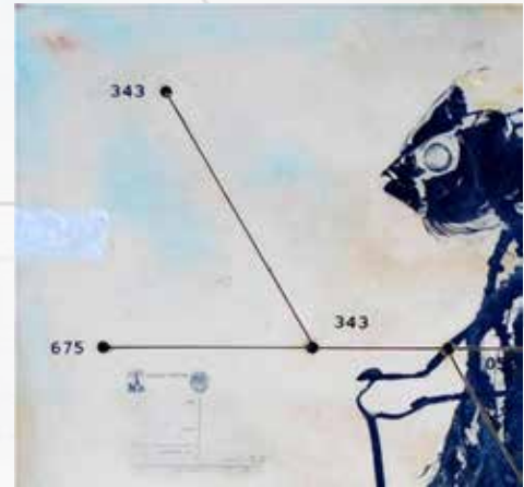
A10029. Detalle. Encausto-Madera. 61 x 64cm.

El nuevo rector y consiliarios serían designados por el saliente y sus consiliarios, ahora representan-