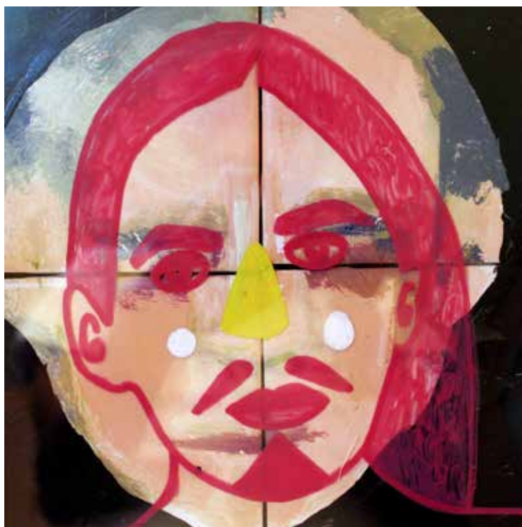
Serie Berdache o Badea (1), Mixta, 22x22 cm, 2018.