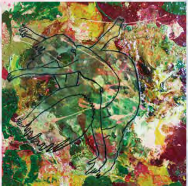
Serie Mestizxs, Mixta, 22x22 cm, 2018.