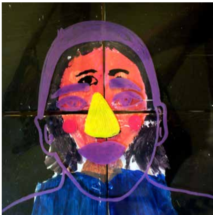
Serie Berdache o Badea (4), Mixta, 22x22 cm, 2018.