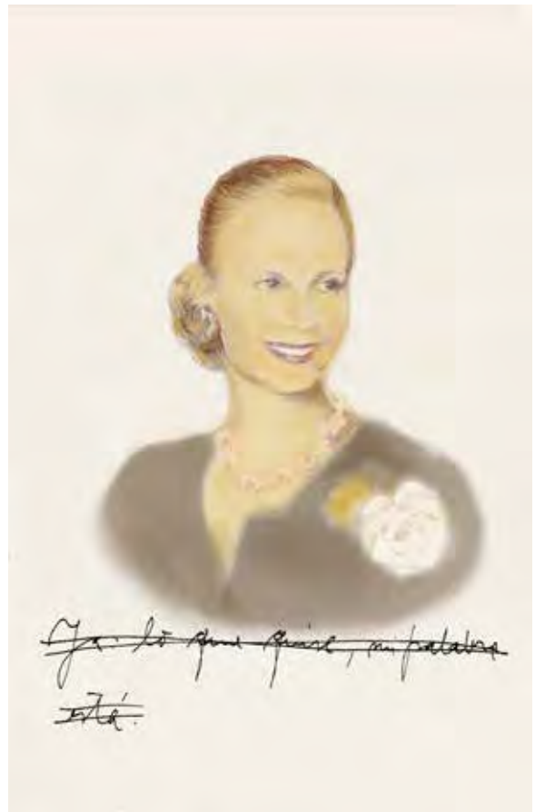
Carlos Coppa. Evita en la hoguera. 2014

tren mucho más lento, en un camino sumamente pedregoso y en algunos casos con fuertes retrocesos. Las diferenciaciones entre las universidades mexicanas, en comunidades y personas concretas, al pasar del tiempo siguen ahí en un entramado complejo donde se embate entre la acumulación de viejos problemas y nuevos retos. Y es precisamente ahí en los rostros del trabajo cotidiano donde lo humano cobra realidad, donde los términos de la competencia, la eficiencia, la eficacia, la calidad, la excelencia y la pertinencia productiva, como asideros ásperos desplazados al discurso educativo, cobran otro significado. Precisamente en los contextos educativos históricamente invisibles, donde la justicia y el progreso siguen todavía en una larga espera.