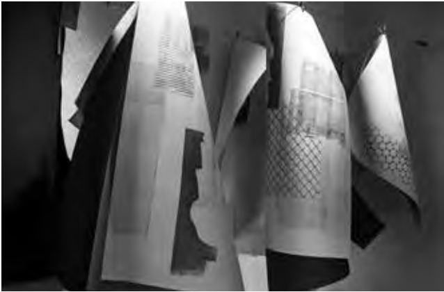
Leticia Barbeito. La memoria de los materiales. Instalación gráfica. 2,5 x 2 x 1 mts