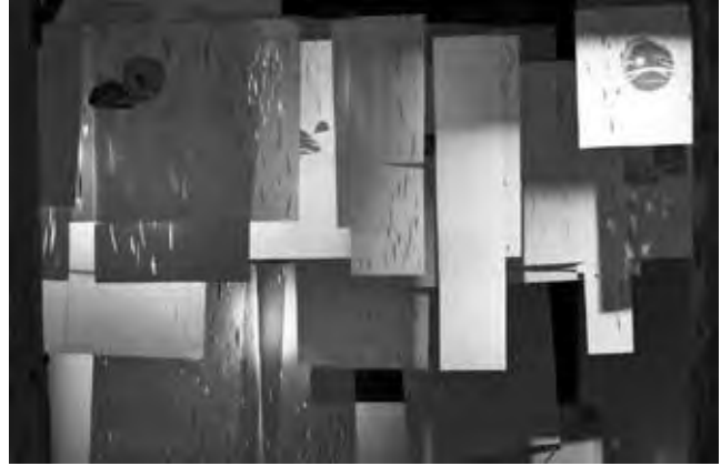
Leticia Barbeito. Ensayo y error. Instalación gráfica. 4 x 3 x 4 mts

al mismo tiempo generaron un repudio más o menos generalizado en el medio universitario pues se entiende como una limitante de la perspectiva humanista y colectiva de la educación (Olivier, 2014).