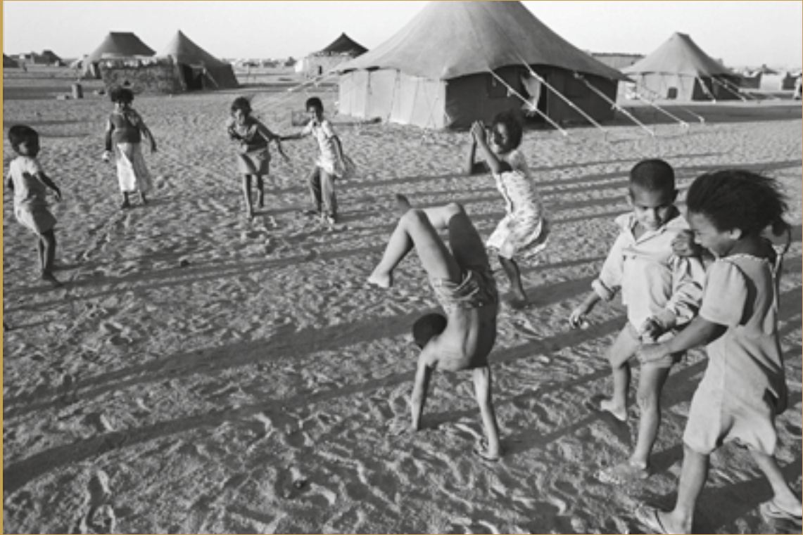
República Árabe Saharahui Democrática, 1982.