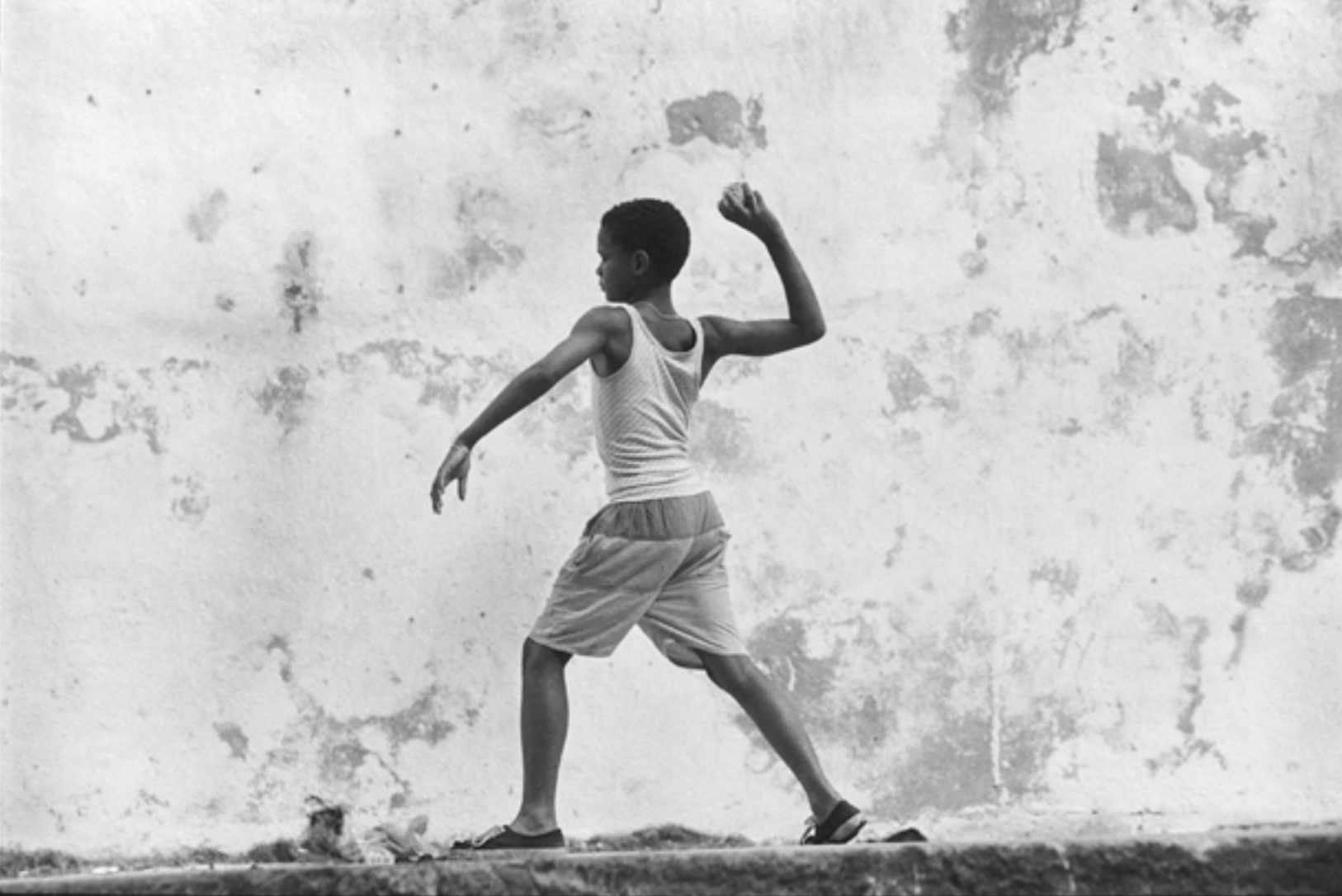
Portada: Refugiados guatemaltecos. 1982.