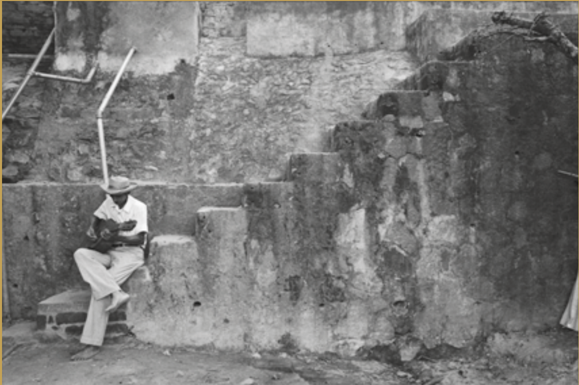
San Salvador, 1984.