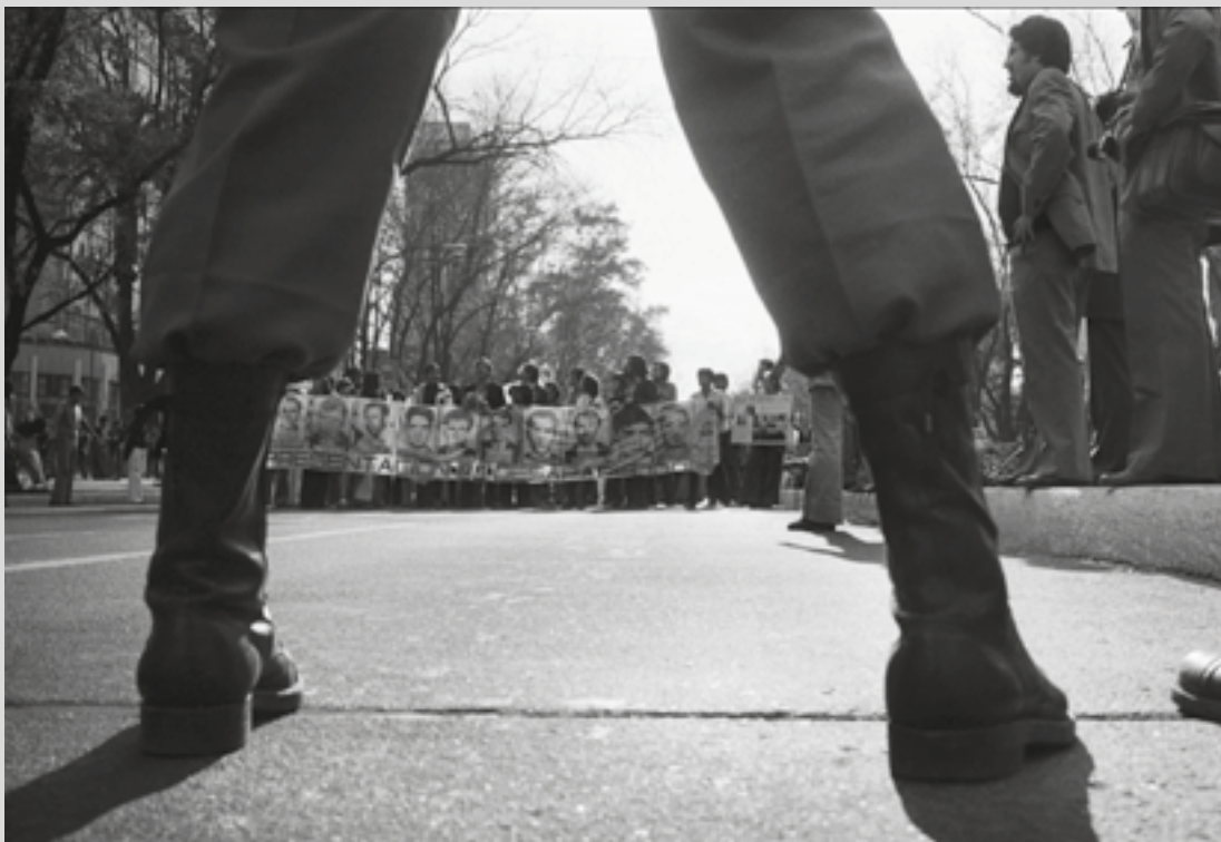
Simojovel Chiapas, 1983.