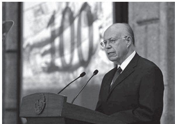
Doctor José Narro Robles, rector de la UNAM.

Frente al ciclo presupuestal que ya inició, con igual respeto pido a la Honorable Cámara de Diputados que se incrementen los recursos destinados a las universidades públicas federales y estatales, a la ciencia y la cultura, además de que el destinado a la UNAM se mantenga en los términos presentados por el Ejecutivo Federal, que mucho reconocemos. Al hacerlo se fortalecerá a las instituciones y se invertirá en el presente y el futuro del país: en su juventud.