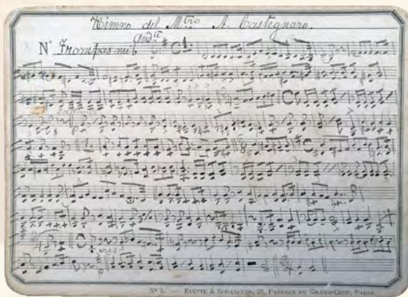
Parte para Trompa o Corno Francés de la obra Himno al Maestro , del compositor Alvice Castegnaro.

El Catálogo de Manuscritos e Impresos del Archivo Histórico Musical es el primer catálogo de su género creado en Costa Rica, donde además se describe el fondo documental fundacional del Archivo Histórico Musical y se pone en evidencia la riqueza musical costarricense.