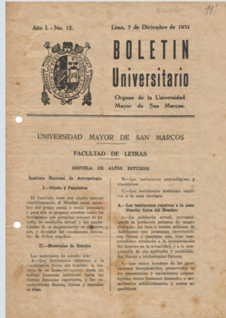
Boletín Universitario. Órgano de la Universidad Mayor de San Marcos. Año I, Núm. 12. Lima, 7 de diciembre de 1931.