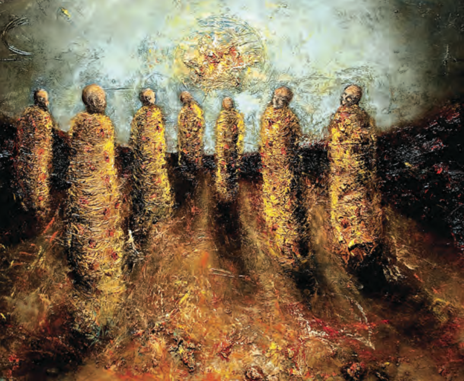
El Sol , Óleo sobre tela, 80 x 100 cm. 2009.

Algunas de sus imágenes flotan sobre los potentes navíos de la poesía y la ficcionalización, haciéndolas irrumpir desde los territorios del inconsciente, de los mitos originarios y de los sueños. Estas obsesiones que han atravesado su obra se manifiestan en un lenguaje que abre nuevas interrogantes para seguir con un trabajo creativo que augura nuevos derroteros, al decantar en él su expresión lírica más