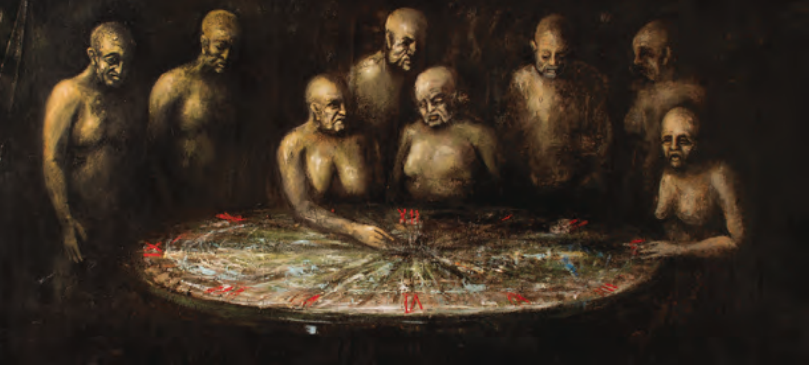
La rueda del tiempo , 200 x 350 cm. 2011.

En la producción artística de Aragón se evidencia su admiración hacia algunos pintores y escultores renacentistas –Leonardo Da Vinci, Miguel Ángel, Tiziano–, integrando desde sus primeras obras un lenguaje barroco con diversos símbolos contemporáneos. Los efectos lumínicos tenebristas remarcan el estilo dramático de las escenas, las cuales finalmente