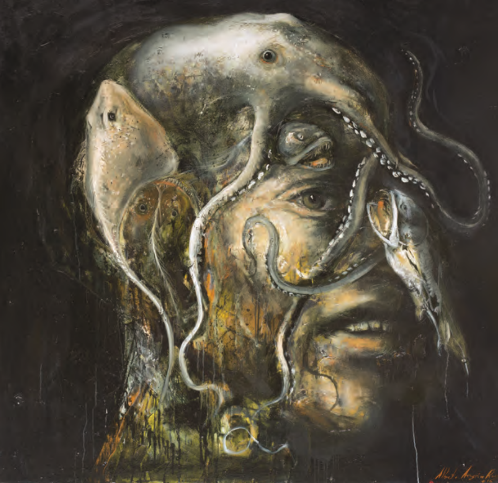
Abundancia, 170 x 170 cm. 2016.

colectivo, la resignificación de los sentidos de la historia o la fuerza reveladora del pez que emerge desde lo abisal del subconsciente.