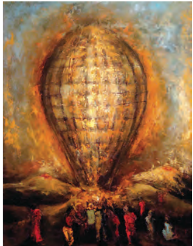
Globo, óleo sobre tela, 90 x 70 cm. 2008.