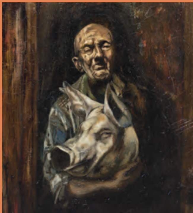
Carnicero, 100 x 80 cm. 2004.

La heterogénea obra de Aragón, en estos prolíficos 17 años de trabajo, muestra resonancias de las influencias y deudas que el artista señala tener con distintos creadores: Caravaggio, El Bosco, Rembrandt, Barceló, Odd Nerdrum, Anselm Kiefer y, sobre todo, de Francisco Goya, pintor que lo apasiona desde siempre. Como a otros artistas, los Caprichos y las Pinturas Negras le han robado el sueño por noches enteras, dejando que algunos de sus trazos y obras se imanten por las luces y sombras iniciadas por este artista, al dejar emerger personajes que expresan el dolor, la irracionalidad, lo grotesco y lo siniestro del ser humano. Hay obras que, definitivamente, poseen el peso del conflicto del artista.