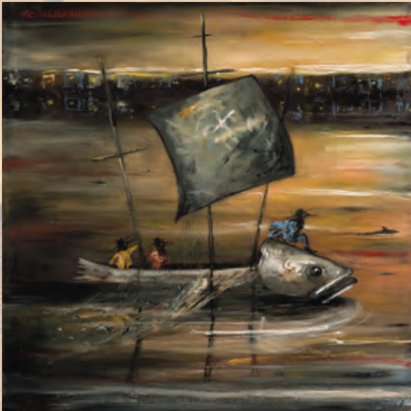
Procesión , 120 x 120 cm. 2013.