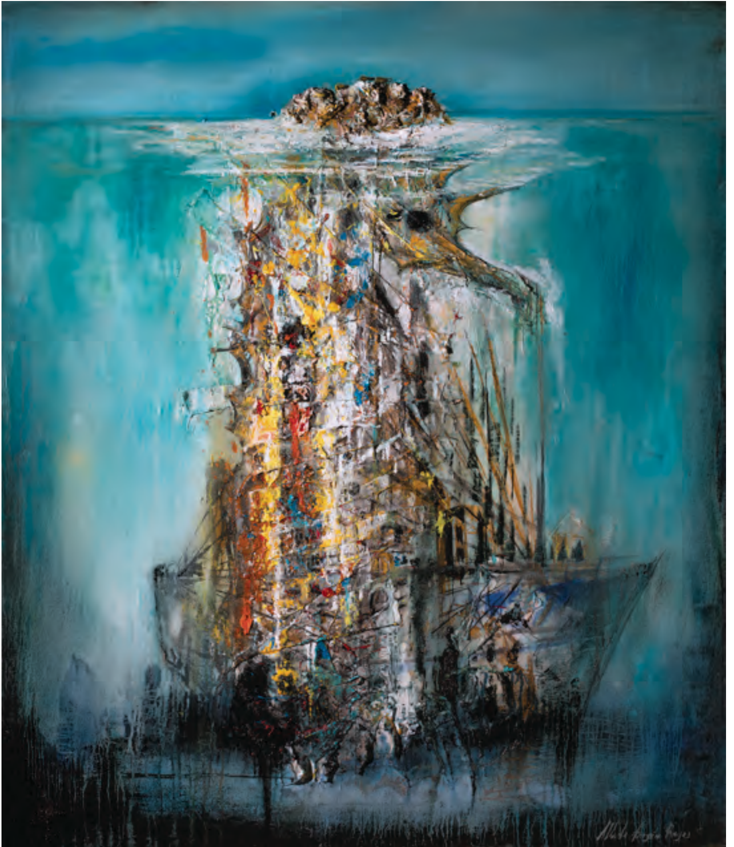
El misterio de la isla , 140 x 120 cm. 2013.