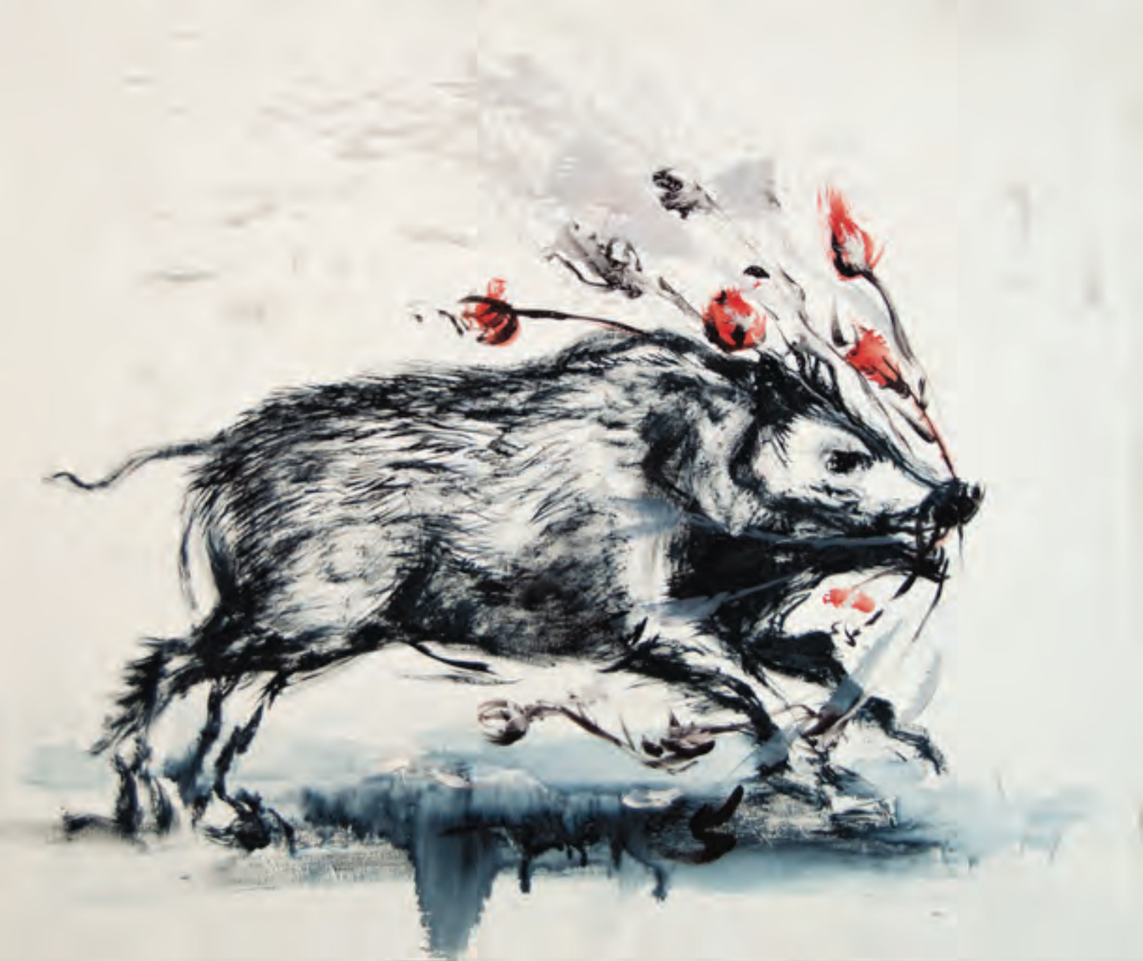
El gran pretendiente, 120 x 140cm. 2014.