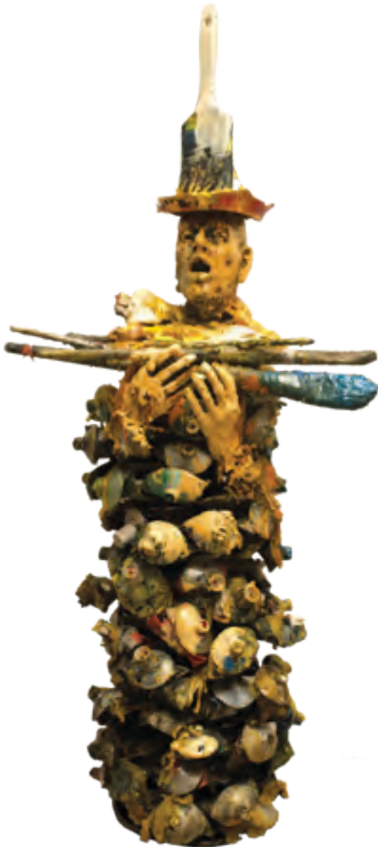
Esculturas de cera y tubos de óleo, 2015.

dades deberían existir según algunos. Cuando estas desigualdades pueden ser identificadas en un grupo particular, es importante examinar de dónde proviene la desigualdad y determinar las razones que la originan.