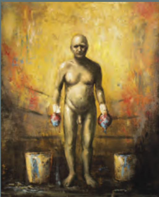
La batalla sublime I , 140 x 120 cm. 2015.