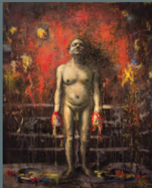
La batalla sublime II , 140 x 120 cm. 2015.

En sus exploraciones estéticas, Aragón ha encontrado profundas significaciones en el arte prehispánico, que también admira. Según señala, el legado estético del arte precolombino no sólo le ha revelado una riqueza de significaciones