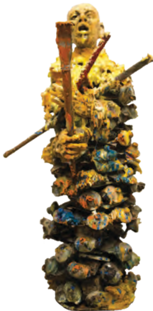
Esculturas de cera y tubos de óleo, 2015.

La equidad para iguales capacidades implica intervenir mediante distintos tipos de acciones para que las personas con potencialidades similares puedan lograr metas equivalentes en diferentes ámbitos de acción. Por capacidad se entenderá el conjunto de funcionalidades que una persona puede alcanzar y, con ellas, la libertad que tiene para elegir entre distintos modos de vida (Sen 1992, 1997; Lorenzeli, 2005). De acuerdo con esta definición, las personas que tengan igual acceso a bienes primarios podrán incrementarlo en forma diferenciada si poseen distintas capacidades. Esto significa que pueden producirse profundas diferencias en la generación y reparto de bienes primarios en función de capacidades diferenciadas. Siguiendo a Sen (1992; 1997), por iguales capacidades se entenderá la libertad equivalente para todas las personas, de modo que logren realizar sus proyectos de vida y puedan cooperar con la sociedad. Esto pone de relieve la importancia de evaluar los objetivos alcanzados (logros o realizaciones), que pueden medirse de diversas formas: utilidad (deseos cumplidos, satisfacciones), opulencia (ingresos, consumo) y calidad de vida. En esta definición,