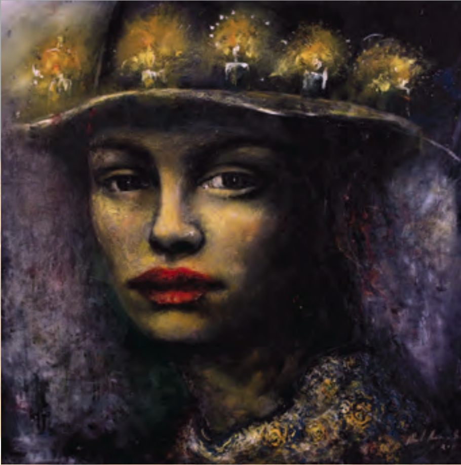
Sombrero de velas , 200 x 200 cm. 2012.