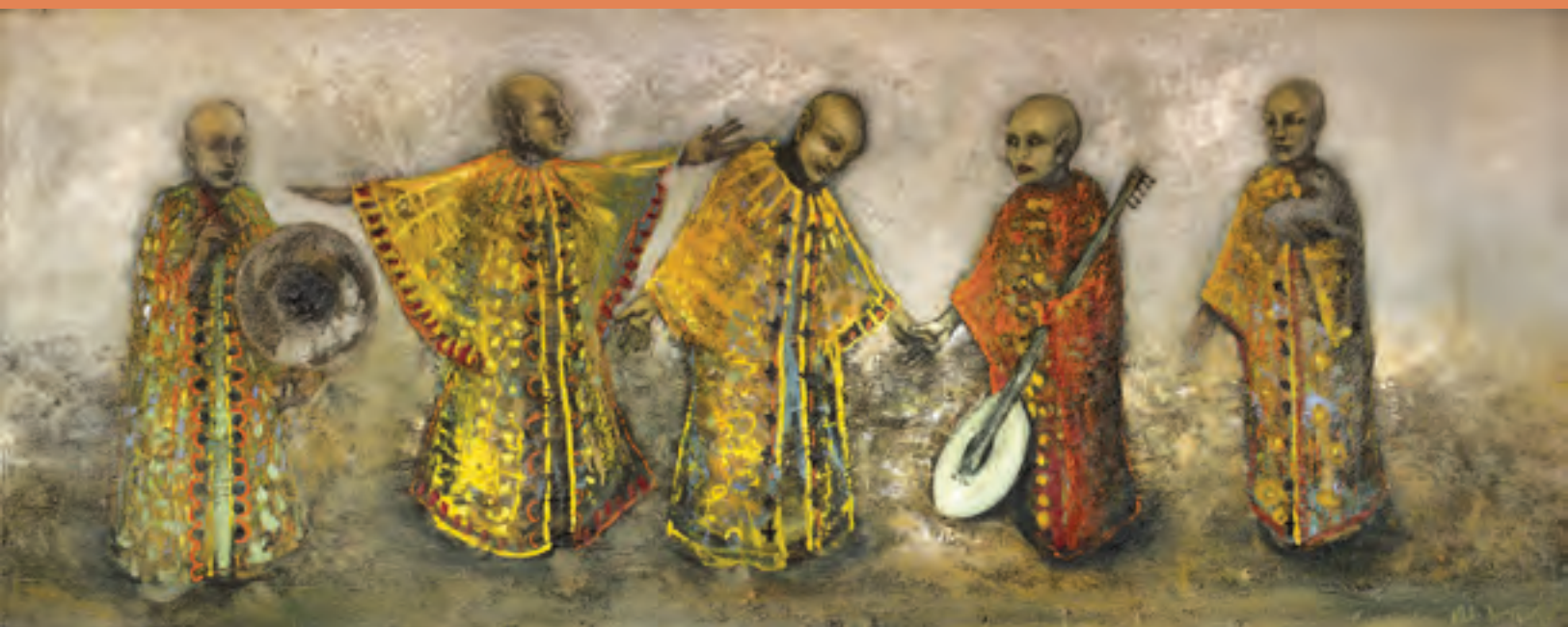
La celebración del sol, 100 x 300 cm. 2010.

La heterogénea obra de Aragón, en estos prolíficos 17 años de trabajo, muestra resonancias de las influencias y deudas que el artista señala tener con distintos creadores: Caravaggio, El Bosco, Rembrandt, Barceló, Odd Nerdrum, Anselm Kiefer y, sobre todo, de Francisco Goya, pintor que lo apasiona desde siempre. Como a otros artistas, los Caprichos y las Pinturas Negras le han robado el sueño por noches enteras, dejando que algunos de sus trazos y obras se imanten por las luces y sombras iniciadas por este artista, al dejar emerger personajes que expresan el dolor, la irracionalidad, lo grotesco y lo siniestro del ser humano. Hay obras que, definitivamente, poseen el peso del conflicto del artista.