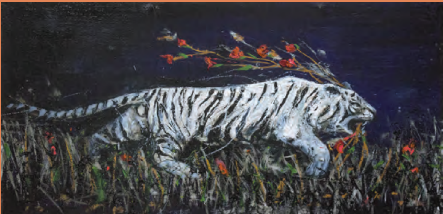
El gran pretendiente , 78 x 150 cm. 2015.

se ven intervenidas al filtrarse como en un rayo de luz, una incisiva ironía, tan refrescante para la enclaustrada formalidad del medio artístico. La ingeniosa irrupción de estos elementos en la obra de arte intenta provocar fisuras en la continuidad de las narraciones, además de mostrar que ningún mito, relato bíblico o ideología son imperturbables.