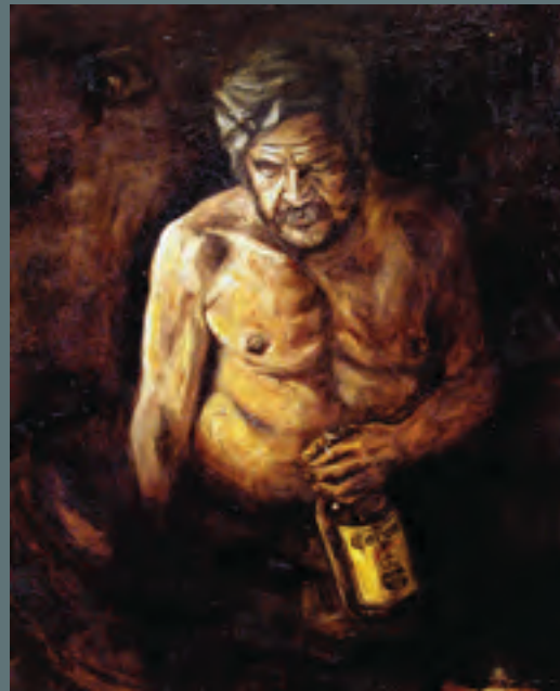
Faustino el Viejo , 100 x 80 cm. 2004.